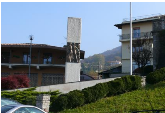
Comune di Peia