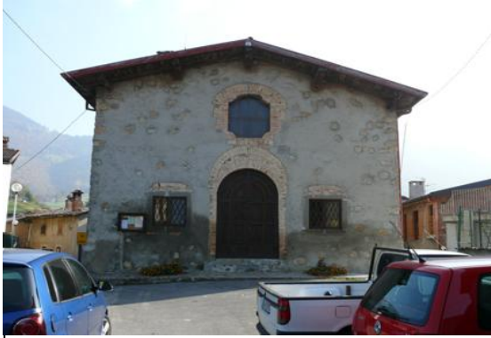
Comune di Peia