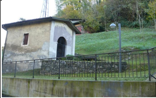
Comune di Peia